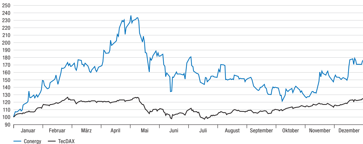
Entwicklung der Conergy Aktie im Geschäftsjahr 2006 (indiziert)

Darüber hinaus sorgt ein regelmäßiger Newsflow für eine kontinuierliche Aufmerksamkeit der Öffentlichkeit und des Kapitalmarkts an unserer Unternehmensentwicklung. Allein in 2006 haben über 50 Presse- und Ad-hoc-Mitteilungen zu einer positiven Wahrnehmung der Conergy und ihrer Markenwelten in den Medien beigetragen. Damit haben wir im Durchschnitt einmal die Woche insbesondere über unser stark wachsendes internationales Geschäft informiert. Unsere Unternehmenskommunikation arbeitet daran, unsere Markenbekanntheit bei internationalen Pressekonferenzen, Messebeteiligungen und Fachkonferenzen weltweit zu steigern. Davon profitiert nicht nur unser Produkt- und Dienstleistungsangebot, sondern auch die Aufmerksamkeit für unsere Aktie.